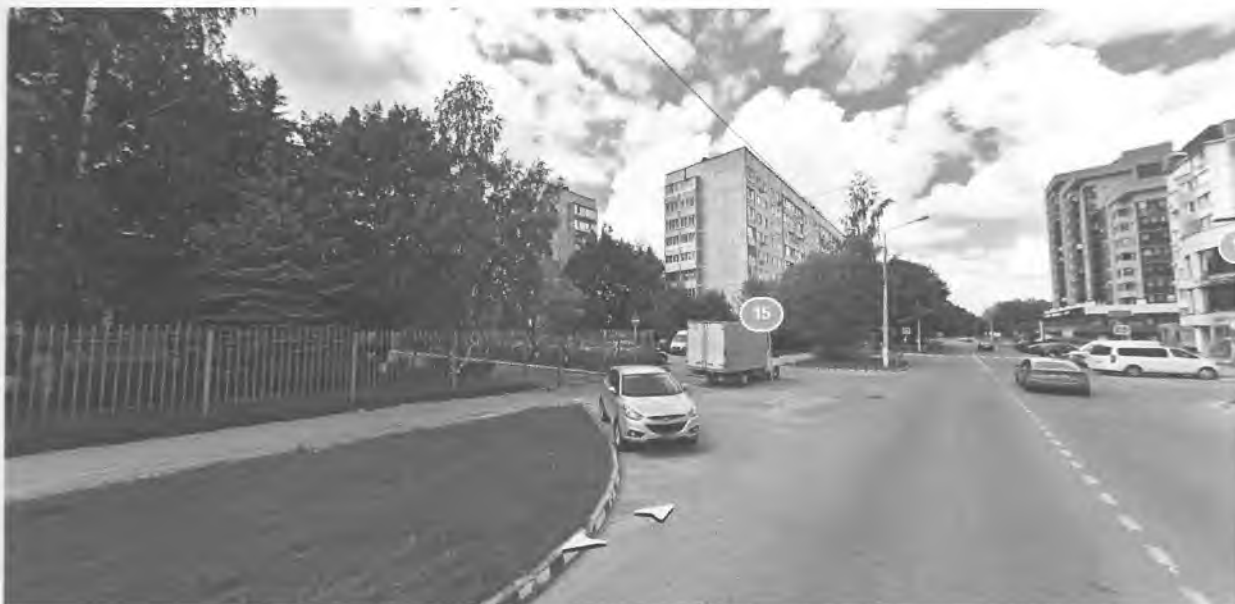
Въезд на территорию МБОУ «СОШ№13» центральные ворота