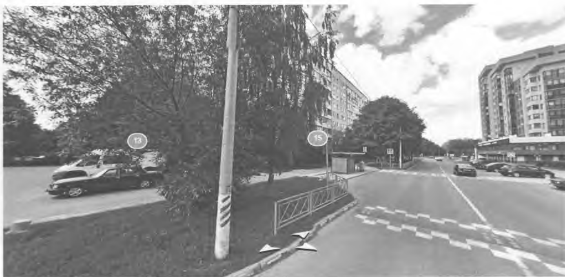
Пешеходный переход и искусственная неровность к остановке со стороны МБОУ «СОШ№13»