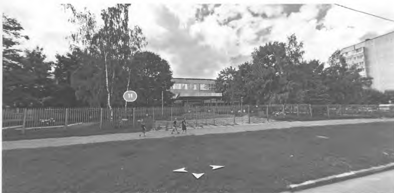
Центральный вход калитка со стороны ул. Калужской