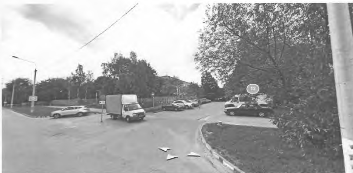
Парковка рядом с МБОУ «СОШ№13»