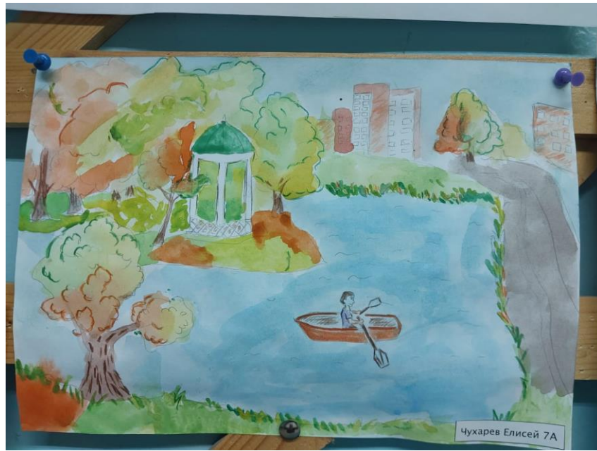
Чухарев Елисей 7А