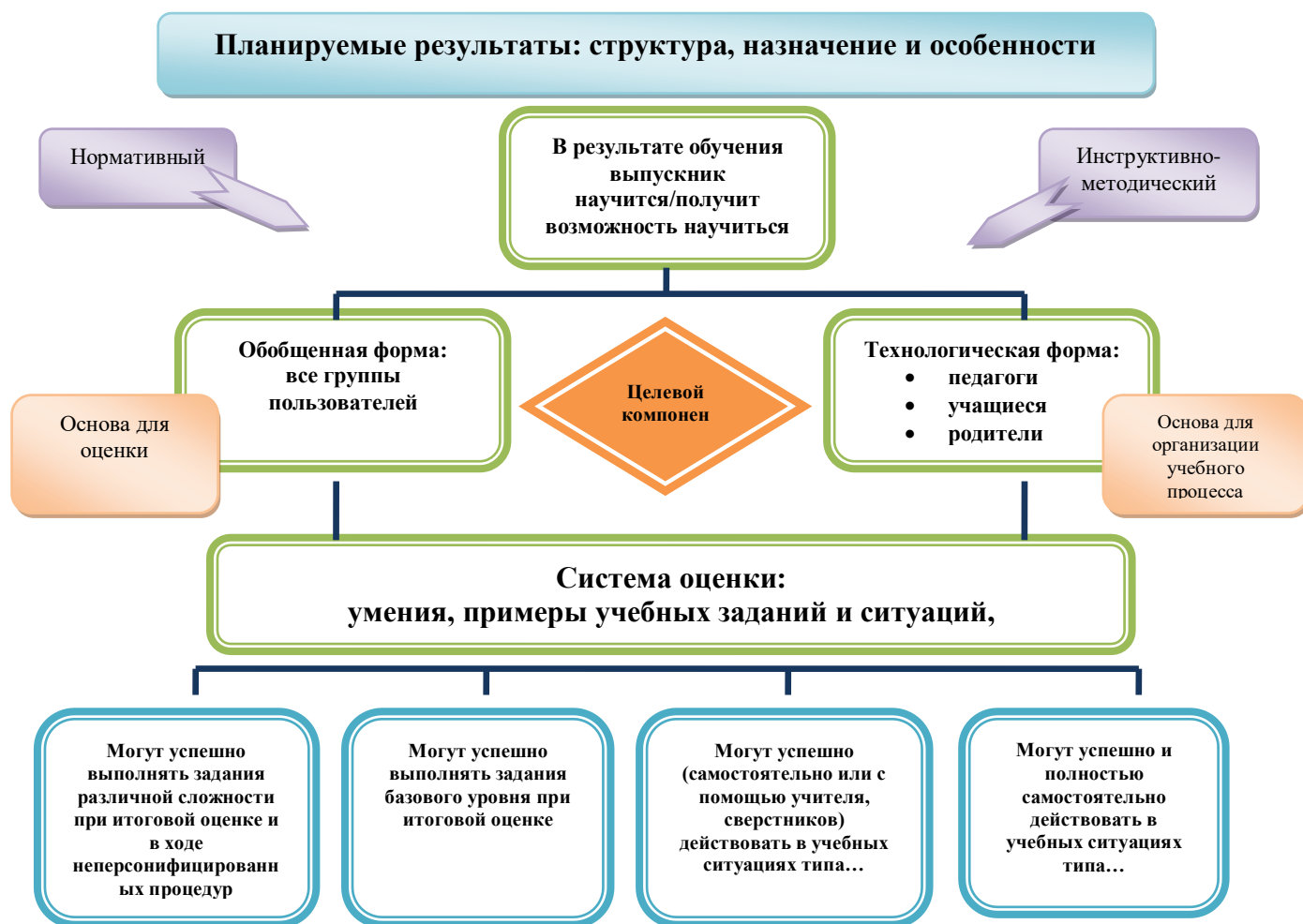
Рис. 1. Особенности структуры планируемых результатов. Функция и назначение.

Система оценки достижения планируемых результатов освоения основной образовательной программы основного общего образования (далее – система оценки) представляет собой один из инструментов реализации требований Стандарта к результатам освоения основной образовательной программы основного общего образования, направленный на обеспечение качества образования, что предполагает вовлечённость в оценочную деятельность как педагогов, так и обучающихся (рис. 1).