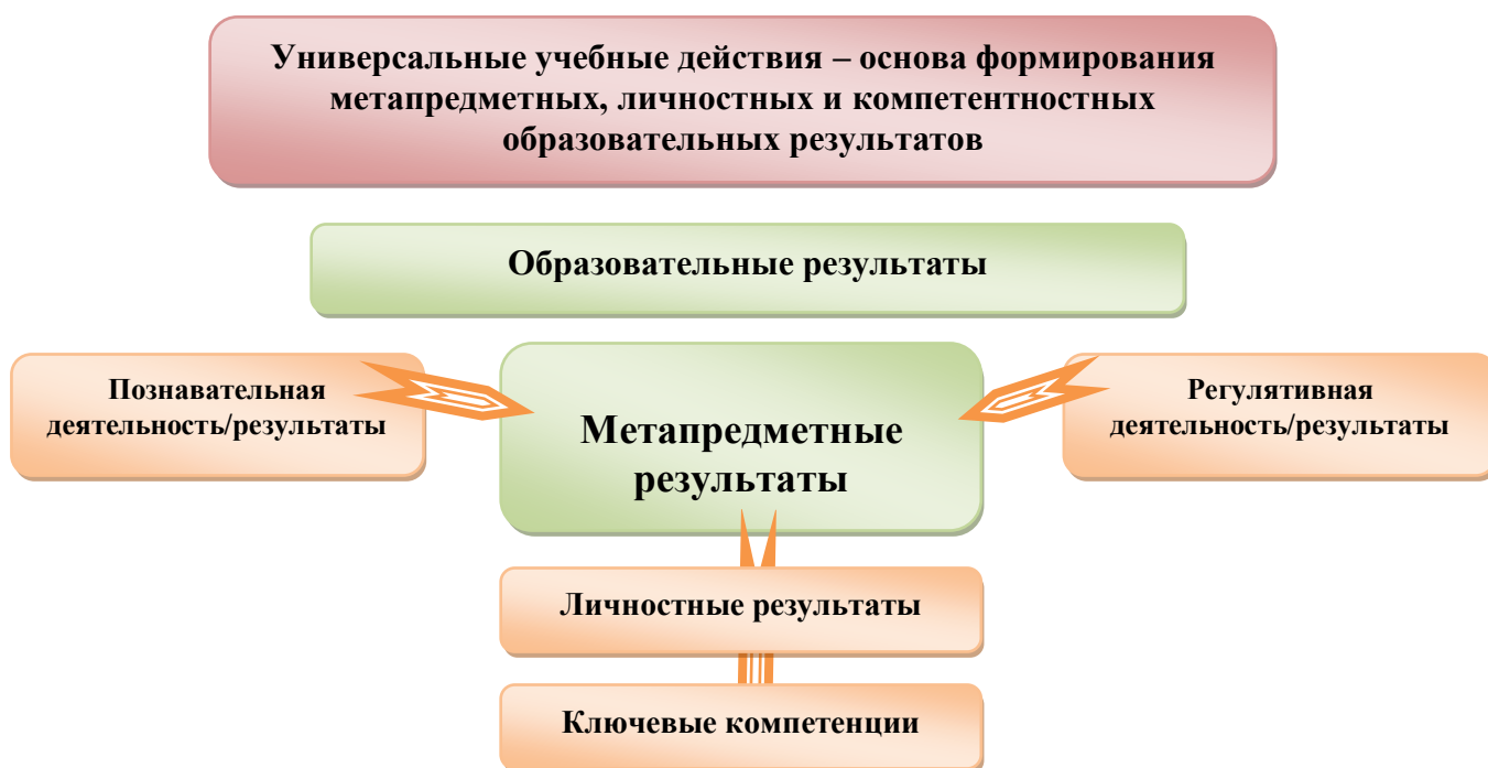
Рис. 3. Система оценки образовательных результатов

Интерпретация результатов оценки ведётся на основе контекстной информации об условиях и особенностях деятельности субъектов образовательного процесса. В частности, итоговая оценка обучающихся определяется с учётом их стартового уровня и динамики образовательных достижений