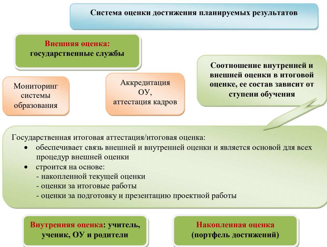
Рис. 2. Система оценки достижения планируемых результатов

Полученные данные используются для оценки состояния и тенденций развития системы образования разного уровня (рис. 2)